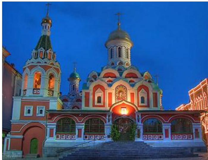
Казански саборни храм, Црвени трг, Москва