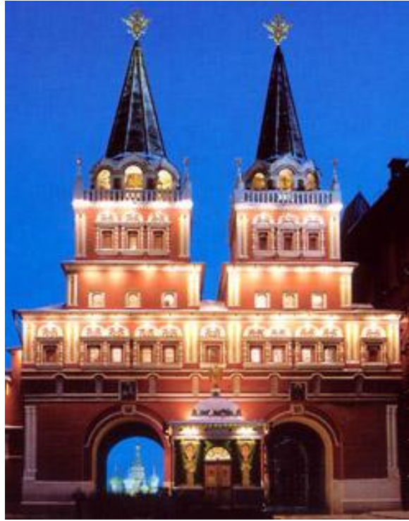
Васкрсењска врата и капела, Москва