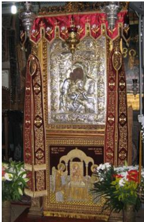
Богородица Достојно јест - Кареја

Близу светогорске престонице, Кареје (Καρυές) у области која припада светом манастиру Пантократору (Παντοκράτορος) налази се велика литица са разним келијама. У једној од тих келија, посвећеној Успењу Владичице Богородице, живео је врлински старац јеромонах са својим послушником. Пошто по обичају сваке недеље у поменутом Протатском скиту службаху бденије, желећи да оде на службу, једне суботње вечери тај старац рече свом ученику: „Чедо, ја одох на уобичајено бденије, а ти остани у келији и читај колико можеш своје правило.“ И изашавши упути се према скиту.