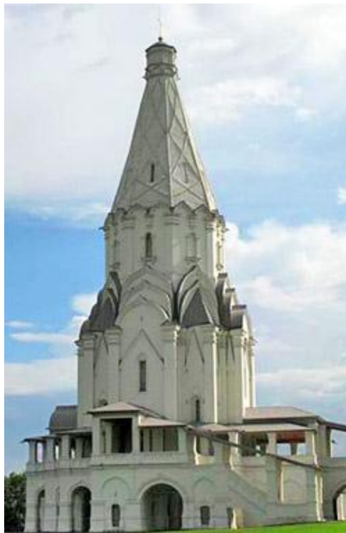
Коломенски храм Вазнесења Господњег