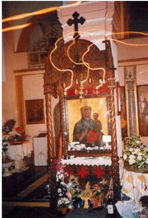
Чудесна фотографија из манастира Лепавина

Настанак ове иконе датира с почетка 16. века и дело је непознатог аутора, а по стилу припада итало-критској школи. О томе где је осликана и како је доспела у манастир Лепавину, нема података. Оно што је познато су дешавања око иконе, која потичу из времена II светског рата, када је 1943. године, у немачком бомбардовању, готово потпуно уништен манастир Лепавина. Тешко су оштећени, торањ и сама црква, на коју су пале две авионске гранате. Том приликом, уништен је скоро комплетан иконостас са иконама. Икона Пресвете Богородице Лепавинске је чудом Божијим остала неоштећена - нашли су је затрпану под дебелим наслагама малтера и цигле неоштећену без и једне огеботине, иако је једна од граната пала на место где де она налазила.