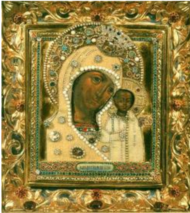
Богородица Казанска, патријаршијски богојављенски храм, Москва

28. јуна 1579. године, велики пожар је избио око храма Светог Николаја Тулског, сажевши део града и претворивши у пепео половину Казанског кремља. Том злу су се радовали незнабошци, мислећи да се Бог разгневио на Хришћане. „Вера Христова“, писао је летописац, „постала је предметом исмевања и поруге“. Међутим, пожар у Казану је заправо био предзнак пада мухамеданства и утврђивања Православља у целом том округу, који се протезао на истоку Русије.