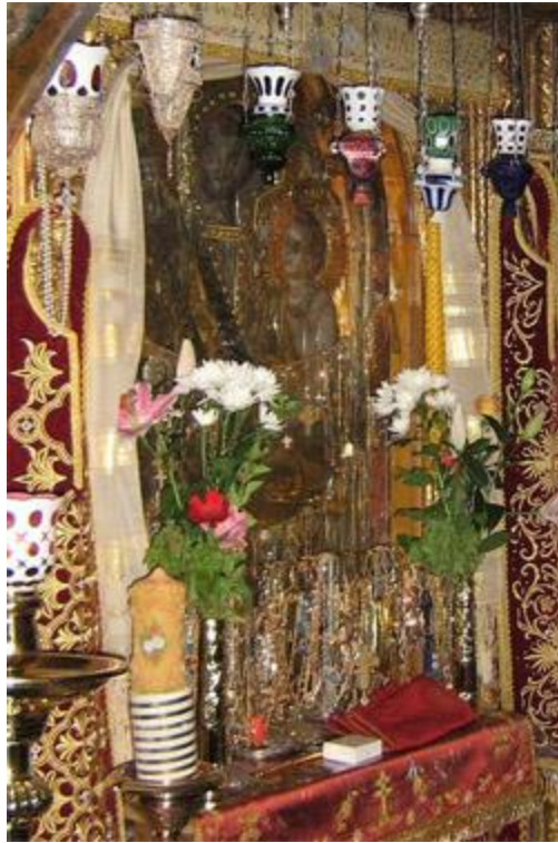
Икона у манастиру Дохојар

И остварише се његова блага надања и не остаде постиђен због толиких молитава и проливених суза. Извор милосрђа и милости, најбржа узданица и утеха свих тужних, Владичица наша Богородица, приклонивши своје човекољубиво ухо, благо је услишила усрдне молитве скрушеног срца његовог, откривши му једнога дана следеће: "Услишена је твоја молитва и нека ти буде опроштено и нека прогледаш као раније. Објави осталим оцима подвижницима и братији да сам ја Мајка Бога Логоса и од Бога покров овом светом манастиру Архангела и помоћ и моћна заштитница, која о њему промишља као браниоц и управитељ. И нека ме од сада монаси призивају за сваку своју потребу, а ја ћу брзо услишити молитву њихову и свих Православних Хришћана који ми са побожношћу прибегавају, јер се зovem Брзопомоћница."