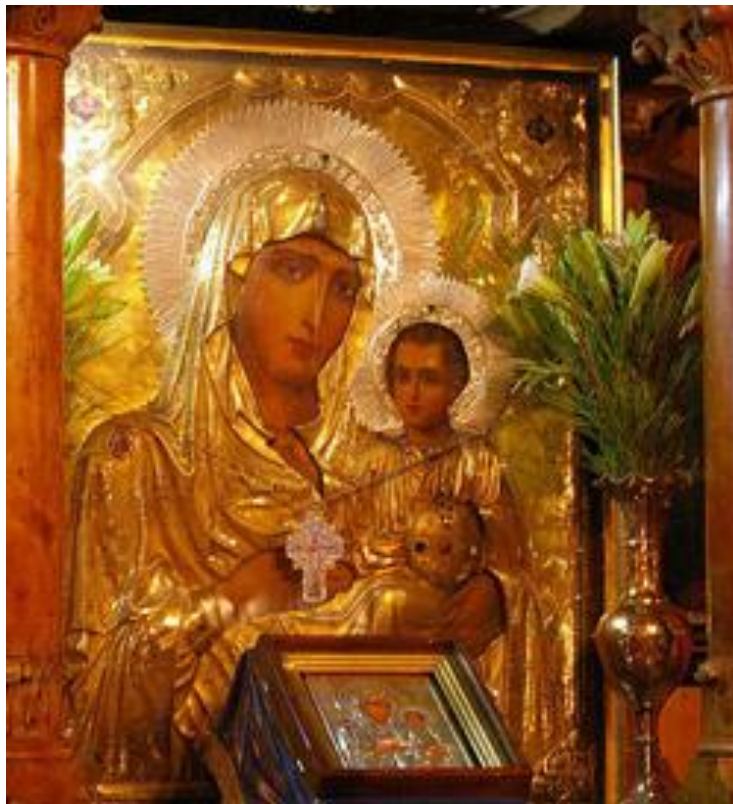
Трећа икона Мајке Божије – Јерусалимска

положено тело Богомајке по Њеном уснућу. Реке поклоника се вековима сливају како на Голготу, тако и у храм мајке Божије, на место њеног уснућа. Многа исцељења су се догађала путем заступништва Богородице након молитава пред Њеном иконом.