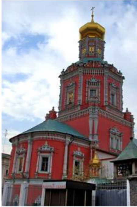
Патријаршијски богојављенски храм, Москва

Одушевљена том вешћу, руска војска је 22. октобра 1612. године однела велику победу, заузела град Китај, а за два дана и Кремљ, потпуно ослободивши Москву од пољских окупатора. 25. октобра је одржана литија на којој је ношена икона, а која је ишла ка Кремљу. Тој литији у сусрет је изашао Архиепископ Арсеније, носећи икону Богородице Владимирске. По ослобођењу Русије, кнез Димитрије Пожарски је поставио Казанску икону у придворској цркви Ваведења у Москви. 1636. године је пренешена у новоизграђени Казански храм на Црвеном тргу. Данас се она налази у патријаршијском богојављенском храму и у Москви.