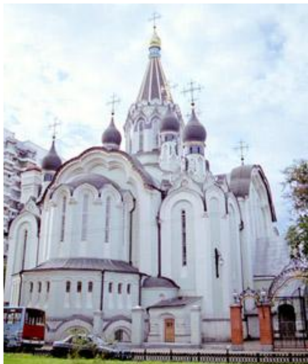
Храм Васкрсења Христовог Соколнически трг, Москва

Чудотворна икона Богордица Иверска (Вратарка, Портаитиса), (грч: Πορταΐτισσα; рус: Иверская, Вратарница); Иверска икона која се данас налази на Светој Гори, у IX веку се налазила код једне благочестиве удовице, која је живела недалеко од Никеје. У време цара Теофила (829-842), иконоборци су уништавали свете иконе, и дошли су и до дома те Хришћанке. Један од војника који је био у пратњи, ударио је копљем по образу лик Богородице Иверске, и истог часа је из удареног места потекла крв. Видевши то чудо, војник паде на колена у покајању, и после тога оде на Атос, где проведе остатак живота у строгом подвижништву. Удовица која се бојала да војници не униште светињу, обећа им новчану награду и умоли их да до јутра не дирају икону. Када су отишли, одлучи да спасе икону, и заједно са својим сином однесе је до обале и пусти у море.